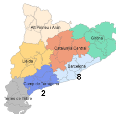
Taula 1: Casos greus de grip A a Catalunya (a 17 de setembre de 2009)